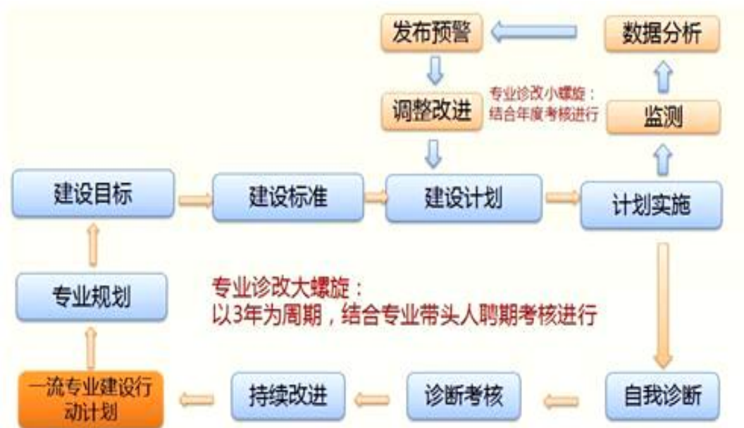
图 3 诊断与改进 8 字螺旋图

1. 建立专业建设和教学质量诊断与改进机制，健全专业教学质量监控管理制度，完善课堂教学、教学评价、实习实训、毕业设计以及专业调研、人才培养方案更新、资源建设等方面质量标准建设，通过教学实施、过程监控、质量评价和持续改进，达成人才培养规格。本专业诊断与改进 8 字螺旋图如下图 2 所示，专业建设质量监控点见表 20。