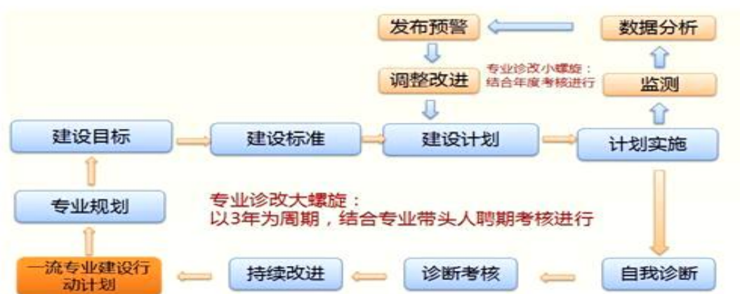
图2 诊断与改进8字螺旋图

1、建立大数据与审计专业建设和教学质量诊断与改进机制，健全专业教学质量监控管理制度，完善课堂教学、教学评价、实习实训、毕业设计以及专业调研、人才培养方案更新、资源建设等方面质量标准建设，通过教学实施、过程监控、质量评价和持续改进，达成人才培养规格。本专业诊断与改进8字螺旋图见图2，专业建设质量监控点见表19。