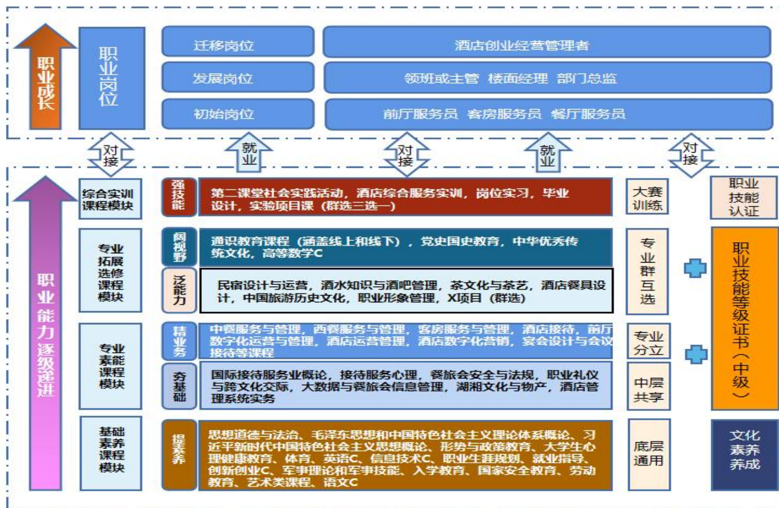
图1 酒店管理与数字化运营专业“岗·课·赛·证”融通课程体系