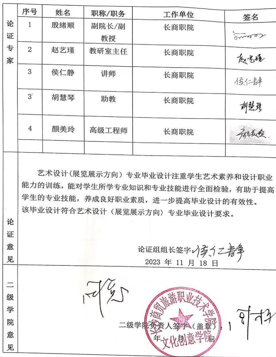
2024届 艺术设计（展览展示方向）专业毕业设计标准论证表