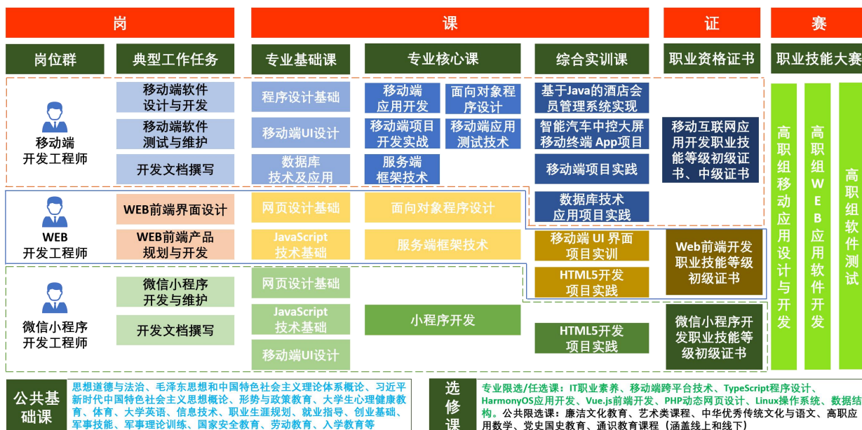
图1 “岗课赛证”四位一体移动应用开发课程体系

1、按照“专业基础共享、专业核心分立、集中实训综合，专业拓展互选”的原则设计“专业基础课程、专业核心课程、综合实训课程、专业限选/任选课程”的四层课程体系。