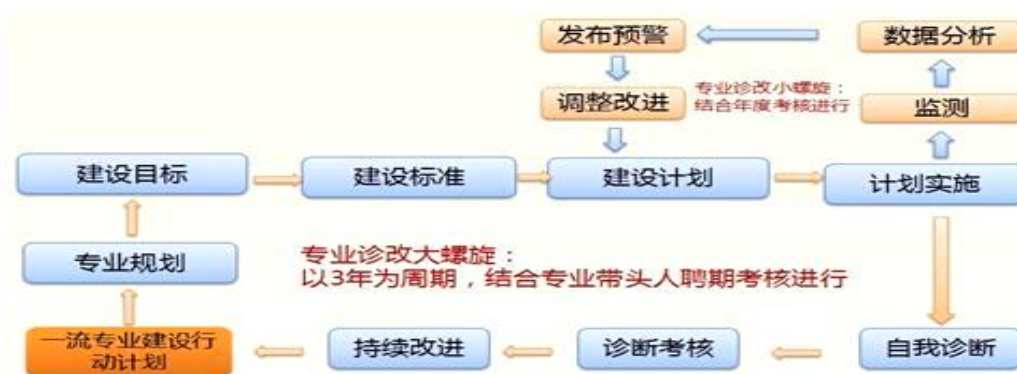
图 1 诊断与改进 8 字螺旋图