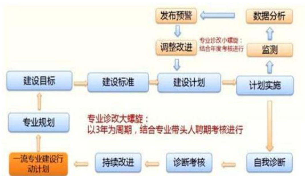
图 1 诊断与改进 8 字螺旋图